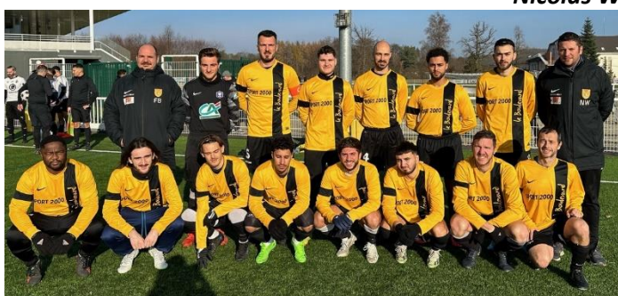
Equipe IPPLING 2023