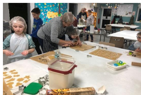
Atelier Bredele Périscolaire décembre 2023