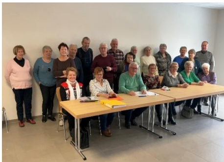
Assemblée Générale Age d'Or 2023

L'Age d'Or : Dans la commune Notre association, l'Age d'Or réunit les aînés deux fois par mois pour des activités ludiques, jeux et échanges d'informations, sur tout ce qui se passe autour d'eux.