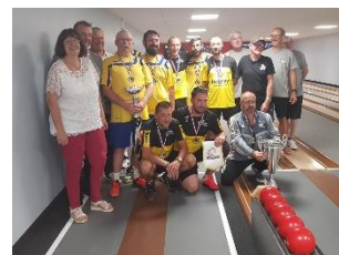
Finale Coupe de France

S.O.I. : Tout au long de cette année 2023, avec l'ensemble des membres du comité, bénévoles, sympathisants, joueurs et membres du club, la SOI s'est efforcée de permettre à une centaine de membres actifs de pratiquer le football dans de bonnes conditions.