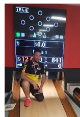
Record de piste coupe de France