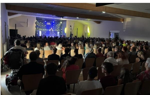
Soirée Magic Pirates