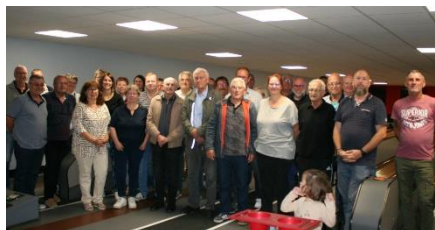
Assemblée Générale Quilleurs 2023