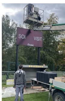
Installation panneau affichage