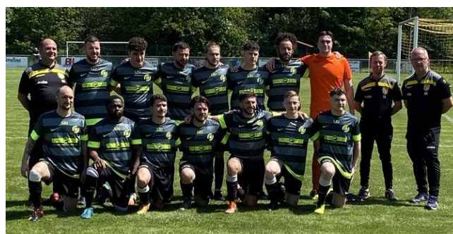
Equipe IPPLING 2023