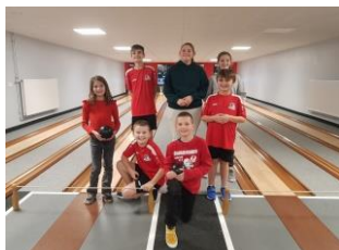
Ecole de Quilles